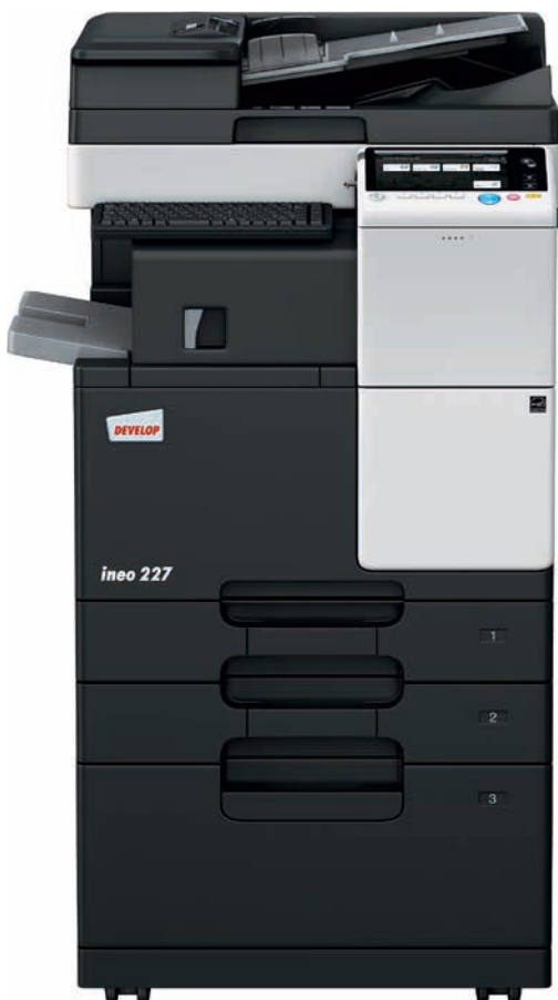
ineo 227 mit Duplex-Origineleinzug (DF-628), integriertem Finisher (FS-533), Papiereinzug (PC-413), Tastaturhalter (KH-102) und externer USB-Tastatur

Jobcenter, Schulen und Universitäten, Ingenieur- und Architekturbüros, Versicherungen, Banken, Bibliotheken: Viele kleine und mittlere Unternehmen oder Organisationen brauchen oft keinen Farbdruck. Was die Nutzer dort wirklich brauchen, ist ein Schwarzweiß-Multifunktionsgerät, das intuitiv bedienbar ist und einfache mobile Nutzung für die steigende Zahl der mobilen Büroangestellten bietet.