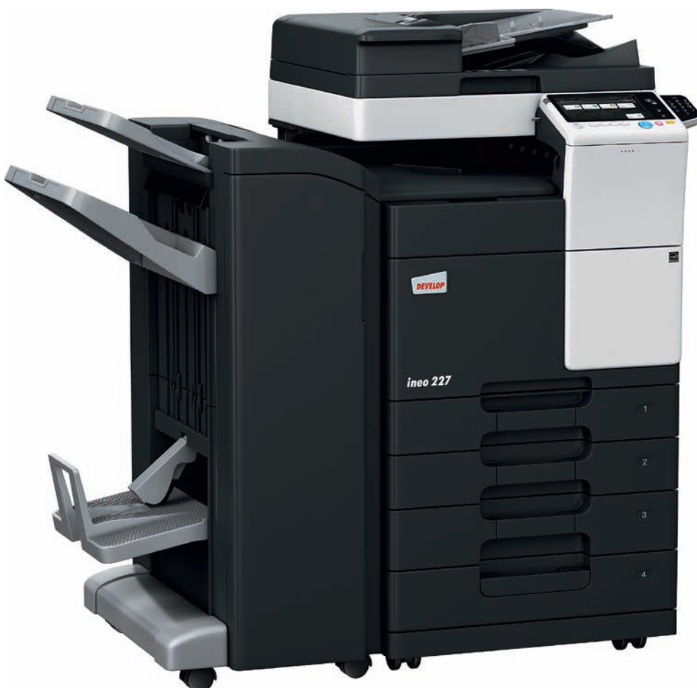
ineo 227 mit Duplex-Origineleinzug (DF-628), Heft-/Broschürenfinisher (FS-534SD), Papiereinzug (PC-213) und 10er-Tastatur (KP-101)

Die Schwarzweißsysteme zeichnen sich durch eine Vielzahl von Energiesparfunktionen aus, die den Energieverbrauch senken. Diese Funktionen sparen nicht nur Geld, sondern sind auch gut für die Umwelt – und Ihre CO 2 -Bilanz.