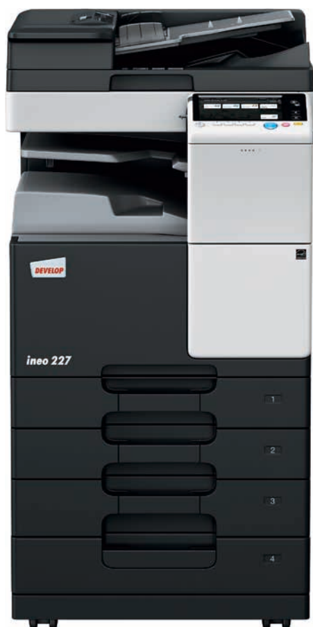
ineo 227 mit Duplex-Origineleinzug (DF-628), Zweifachablage (JS-506) und Papiereinzug (PC-213)